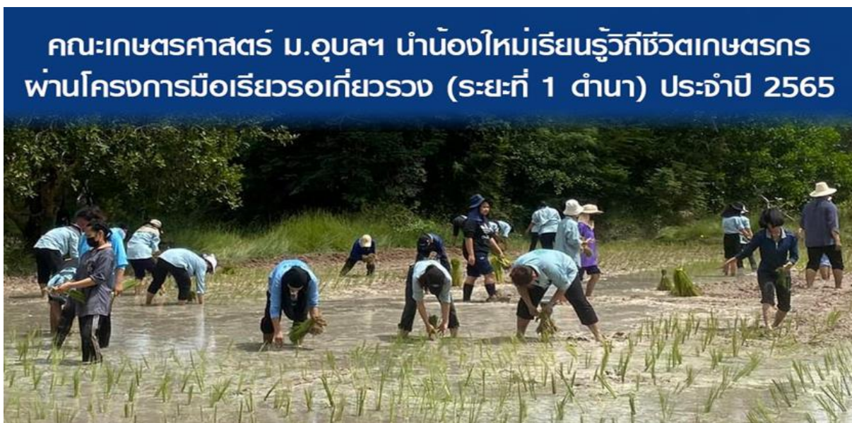
ภาพที่ 2.17 โครงการมือเรียวรอเกี่ยวรวง จัดขึ้นในวันที่ 9 กรกฎาคม 2565