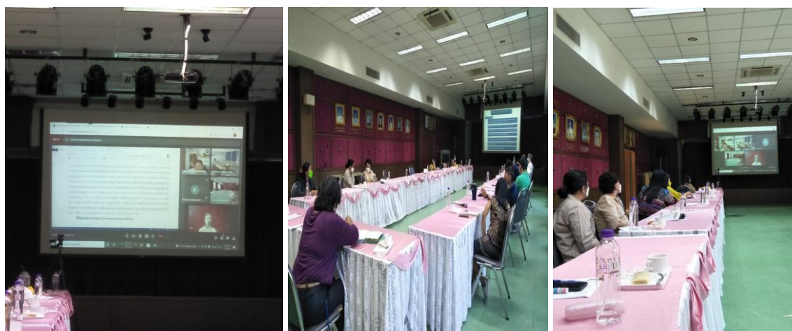
ภาพที่ 2.43 การประชุมติดตามผลการดำเนินงานแผนปรับปรุง Improvement plan การดำเนินงานของคณะ ประจำปี 2564 ในวันจันทร์ที่ 17 มกราคม 2565 เวลา 13.30-16.30 น. ห้องประชุมวรพงษ์ สุริยภัทร