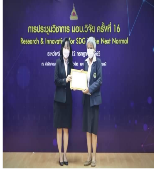
ภาพที่ 2.28 พิธีมอบรางวัลเชิดชูเกียรติแก่นักวิจัย ในงานประชุมวิชาการ มอบ.วิจัย ครั้งที่ 16 วันที่ 11 กรกฎาคม 2565