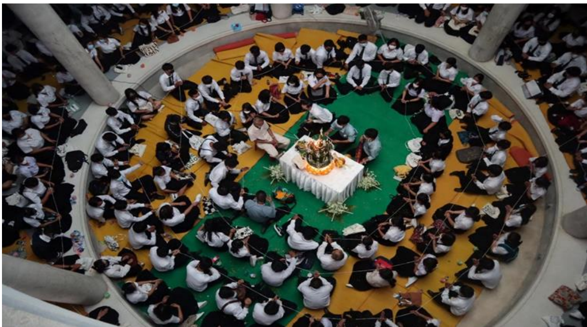
ภาพที่ 2.12 โครงการ Aggie Day 2021 จัดขึ้นในระหว่างวันที่ 11 - 19 มิถุนายน 2565