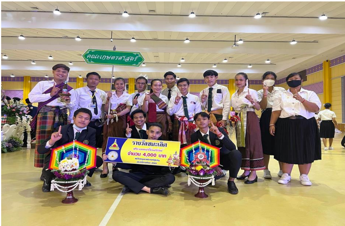
ภาพที่ 2.14 โครงการทำบุญตักบาตรน้องใหม่และพิธีไหว้ครูประจำปีการศึกษา 2565 ในวันที่ 30 มิถุนายน 2565