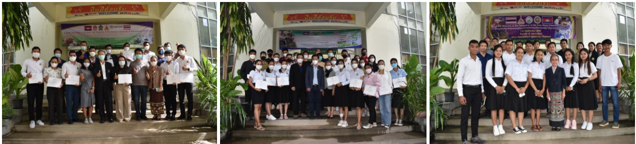
ภาพที่ 2.23 กิจกรรมความร่วมมือทางวิชาการกับ National University of Battambang และ Svay Reing University ประเทศกัมพูชา