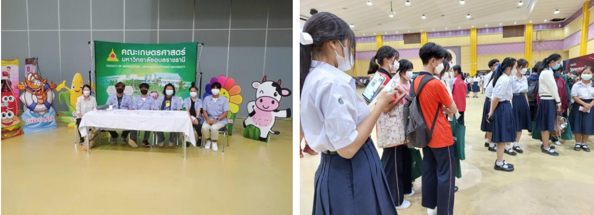
ภาพที่ 2.8 คณะเกษตรศาสตร์ มหาวิทยาลัยอุบลราชธานี ร่วมจัดบูธแนะแนวและประชาสัมพันธ์หลักสูตร ให้กับนักเรียน เพื่อเข้าศึกษาต่อ ปีการศึกษา 2566 ในงาน Thailand University Expo 2022 ณ อาคารเฉลิมพระเกียรติฯ มหาวิทยาลัยอุบลราชธานี, 1 ตุลาคม 2565