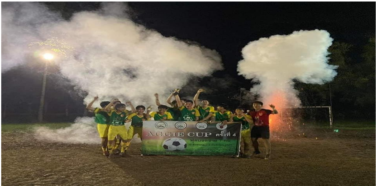
ภาพที่ 2.18 โครงการส่งเสริมและพัฒนาสุขภาพ การแข่งขันฟุตบอลเชื่อมความสัมพันธ์ AGGIE CUP ครั้งที่ 4 คณะเกษตรศาสตร์ มหาวิทยาลัยอุบลราชธานี ประจำปีการศึกษา 2565 ระหว่างวันที่ 19 สิงหาคม 2565 - 2 กันยายน 2565