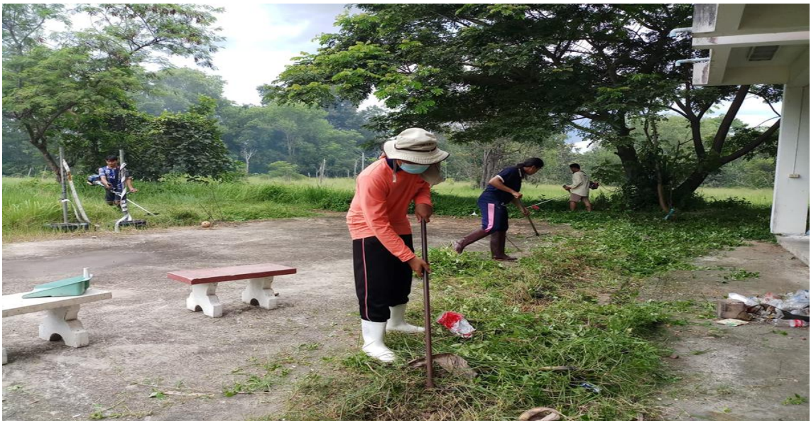
ภาพที่ 2.16 โครงการพัฒนาทักษะและปรับปรุงภูมิทัศน์โดยรอบคณะเกษตรศาสตร์ มหาวิทยาลัยอุบลราชธานี 2565 จัดขึ้นในระหว่าง 9 – 23 กรกฎาคม 2565