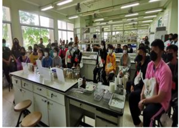
ภาพที่ 2.7 กิจกรรมโครงการส่งเสริมการสร้างทัศนคติและแรงจูงใจเพื่อเลือกศึกษาต่อในระดับอุดมศึกษาประจำปีการศึกษา 2565

2.2) กิจกรรม : คณะเกษตรศาสตร์ มหาวิทยาลัยอุบลราชธานี ร่วมจัดบูธแนะแนวและประชาสัมพันธ์หลักสูตรให้กับนักเรียน เพื่อเข้าศึกษาต่อ ปีการศึกษา 2566 ในงาน Thailand University Expo 2022 ณ อาคารเฉลิมพระเกียรติฯ มหาวิทยาลัยอุบลราชธานี, 1 ตุลาคม 2565