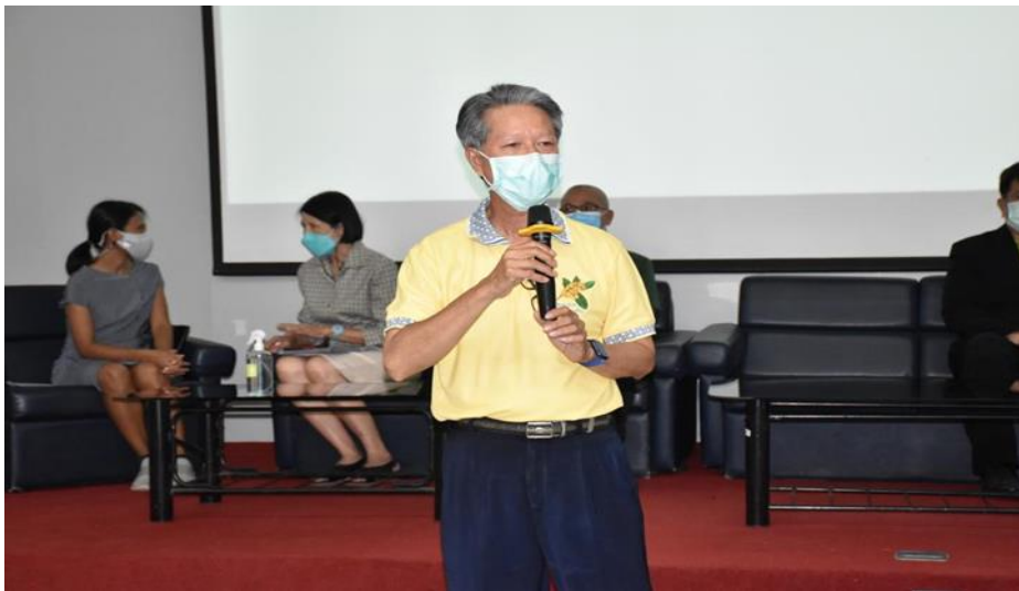
ภาพที่ 2.11 โครงการปฐมนิเทศนักศึกษาใหม่ ประจำปีการศึกษา 2565 วันที่ 2 มิถุนายน 2565