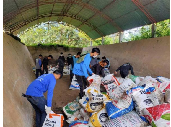
ภาพที่ 2.39 พื้นที่ดำเนินการโครงการ/กิจกรรมการมุ่งสู่การเป็นมหาวิทยาลัยสีเขียว

คณะเกษตรศาสตร์ ตระหนักถึงการให้บริการด้านสถานที่แก่นักศึกษา บุคลากร และบุคคลทั่วไปที่มาติดต่อประสานงาน จึงได้จัดตั้งคณะกรรมการด้านสาธารณูปโภค เพื่อปรับปรุงโครงสร้างพื้นฐาน ความสะอาด และความสวยงามของอาคารเรียน ตลอดจนบริเวณพื้นที่ต่างๆ ของคณะเกษตรศาสตร์ เช่น นำต้นไม้ที่สามารถปลูกในร่มได้มาประดับตกแต่ง เพื่อเพิ่มพื้นที่สีเขียวให้กับหน่วยงาน มีการปรับแต่งภูมิทัศน์ภายในฟาร์ม และบริเวณด้านหลังของตึกเพื่อให้มีความร่วมรื่นสวยงาม มีไม้ดอกไม้ประดับตกแต่งทางเดินขึ้นตึกด้านหน้า คณะกรรมการจะคอยตรวจสอบการทำงานของแม่บ้านให้รักษาความสะอาดในห้องเรียน ห้องน้ำ และพื้นที่บนตึกเพื่อให้อาคารมีความน่าอยู่ คณะกรรมการจะคอยตรวจสอบความพร้อมของอุปกรณ์ในห้องเรียนทั้งชุดเครื่องเสียงและคอมพิวเตอร์เพื่อให้มีสภาพพร้อมใช้งาน ตลอดจนระบบเครื่องปรับอากาศและผ้า màn บังแสงให้มีความสะอาดพร้อมใช้งานตลอดเวลา และมีการรณรงค์การประหยัดน้ำ ประหยัดไฟโดยการใช้ข้อความที่เชิญชวนนักศึกษา บุคลากร ให้ช่วยกันรักษาความสะอาดและประหยัดพลังงาน