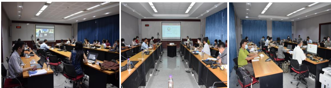
ภาพที่ 2.44 ประชุมการจัดทำแผนพัฒนาคุณภาพการศึกษาเพื่อขับเคลื่อนคุณภาพสู่ระดับ 300 คะแนน ในวันที่ 6 กันยายน 2565 เวลา 09.00-12.00 น. ณ ห้องประชุมบุญทริก มหาวิทยาลัยอุบลราชธานี

1.2)การจัดทำแผนพัฒนาคุณภาพการศึกษาเพื่อขับเคลื่อนคุณภาพสู่ระดับ 300 คะแนน ในวันที่ 6 กันยายน 2565 เวลา 09.00-12.00 น. ณ ห้องประชุมบุญทริก มหาวิทยาลัยอุบลราชธานี