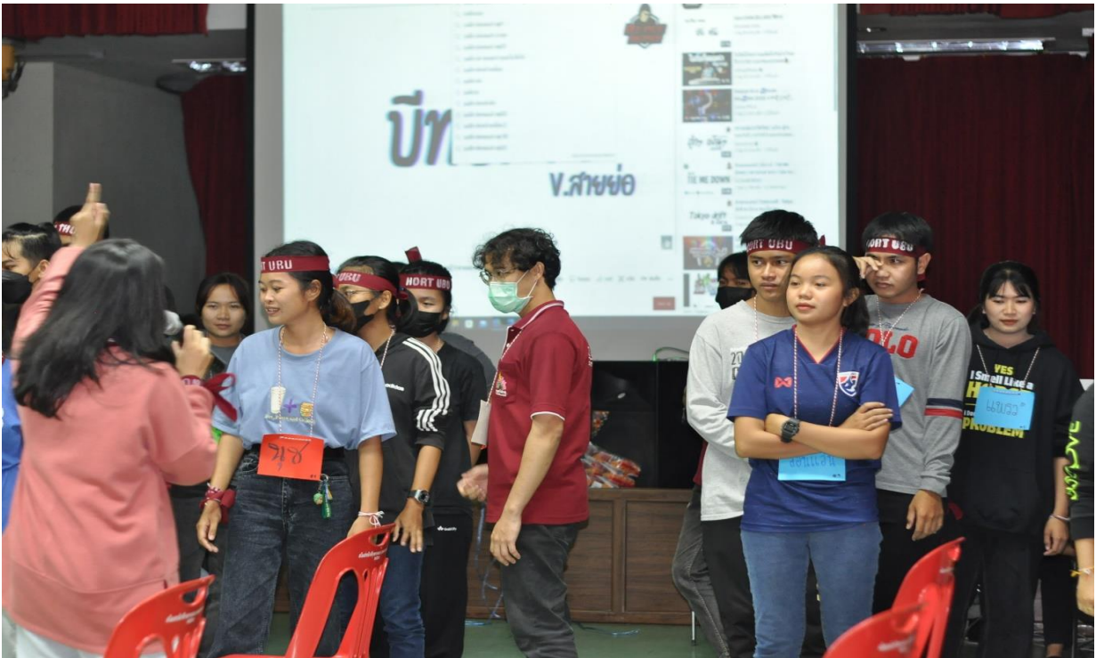
ภาพที่ 2.19 โครงการปฐมนิเทศสาขาประจำปีการศึกษา 2565 จัดขึ้นในวันที่ วันที่ 20 สิงหาคม 2565