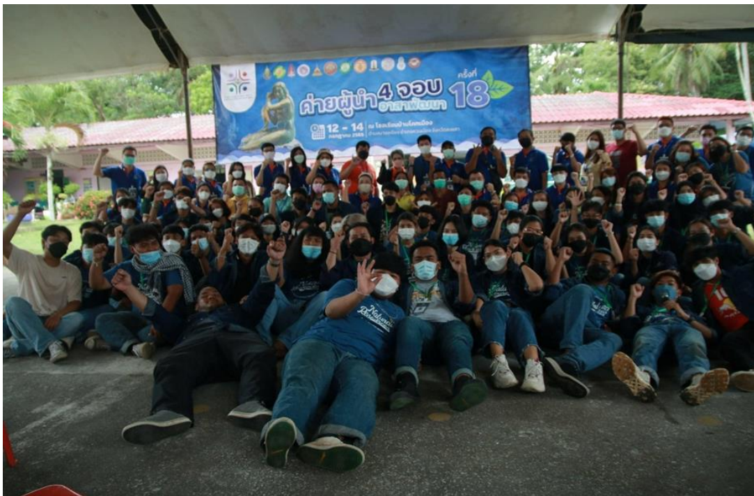
ภาพที่ 2.15 โครงการทำบุญตักบาตรน้องใหม่และพิธีไหว้ครูประจำปีการศึกษา 2565 ในวันที่ 30 มิถุนายน 2565