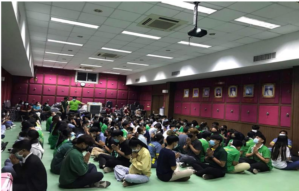
ภาพที่ 2.13 โครงการกิจกรรมส่งเสริมเอกลักษณ์นักศึกษาคณะเกษตรศาสตร์ “ยิ้ม ไหว้ แต่งกายดี” จัดขึ้นในวันที่ 13 15 17 มิถุนายน 2565