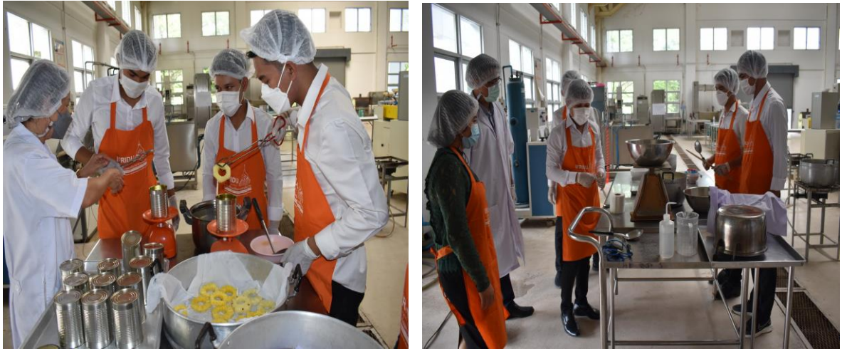
ภาพที่ 2.20 ความสามารถของบัณฑิตในการบูรณาการองค์ความรู้และทักษะทางวิชาการและวิชาชีพ