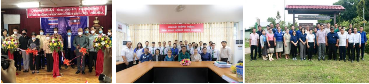
ภาพที่ 2.22 กิจกรรมความร่วมมือทางวิชาการระหว่างคณะเกษตรศาสตร์และกระทรวงกลาโหมและป่าไม้ ประเทศสาธารณรัฐประชาธิปไตยประชาชนลาว