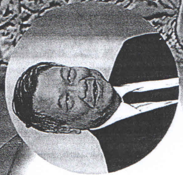
นายจักรมณท์ ผาสุกวานิช อดีตรัฐมนตรีว่าการกระทรวง อุตสาหกรรม