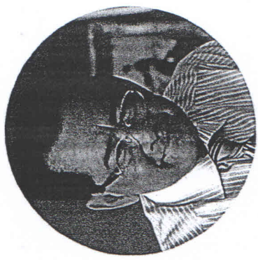
ดร.ณรงค์ชัย อัครเศรณี นายกสภามหาวิทยาลัยขอนแก่น และ อดีตรัฐมนตรีว่าการกระทรวงพลังงาน