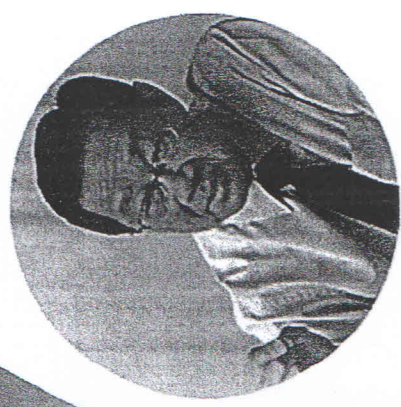
ม.ร.ว. ปรีดิยาธร เทวกุล กรรมการสภามหาวิทยาลัยขอนแก่น และ อดีตรองนายกรัฐมนตรีฝ่ายเศรษฐกิจ