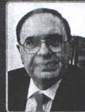
Prof. Atta-ur-Rahman, University of Karachi, Pakistan