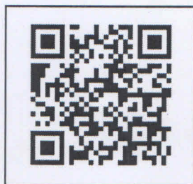
Link รับสมัคร